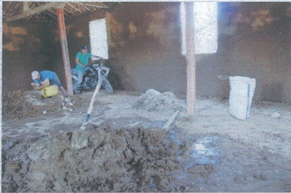
Fotografía 7: Preparación de material para proyecto: “La antigua iglesia de Progreso”.