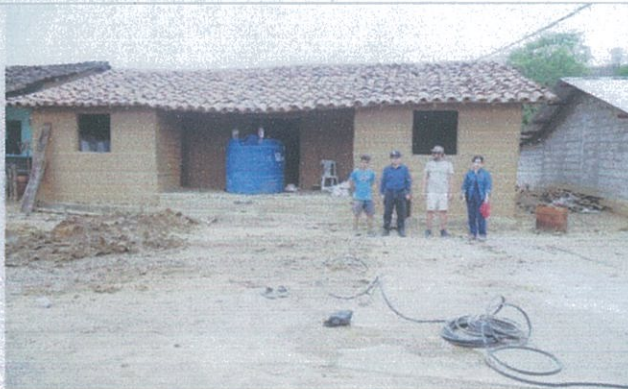
Fotografía 9: Equipo técnico de seguimiento y ejecución de los proyectos.