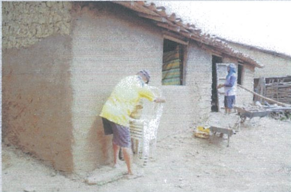
Fotografía 3: Avance de los trabajos del proyecto: “Escuelita de barro / casa comunal”.