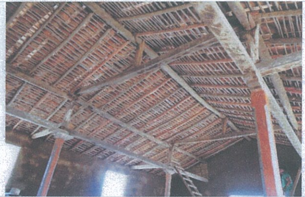
Fotografía 8: Avance de los trabajos del proyecto: “La antigua iglesia de Progreso”