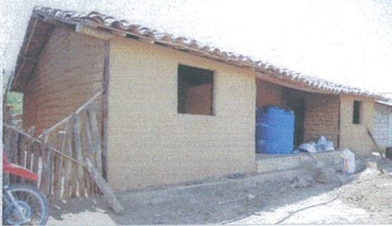
Fotografía 1: Avance de los trabajos del proyecto: “Escuelita de barro / casa comunal”.