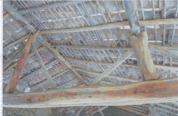
Fotografía 4: Avance de los trabajos del proyecto: “Escuelita de barro / casa comunal”.