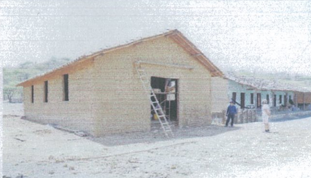
Fotografía 5: Avance de los trabajos del proyecto: “La antigua iglesia de Progreso”