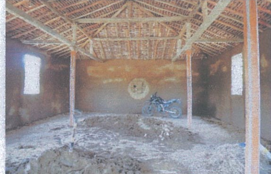
Fotografía 6: Avance de los trabajos del proyecto: “La antigua iglesia de Progreso”