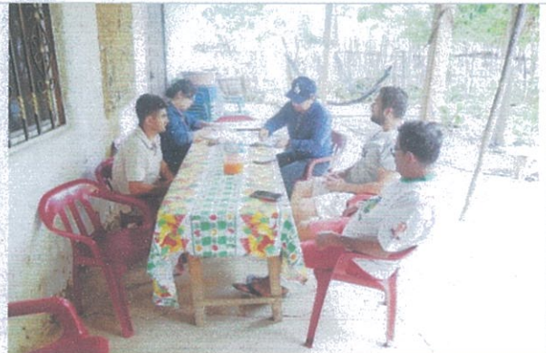
Fotografía 10: Reunión de coordinación con el Beneficiario de los dos proyectos.