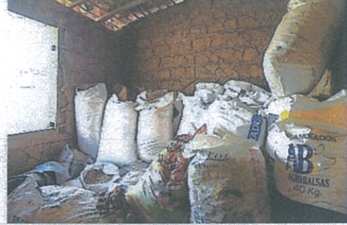
Fotografía 2: Almacenamiento de material, proyecto: “Escuelita de barro / casa comunal”.